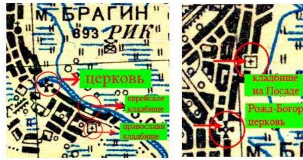
Карта Генерального штаба РККА 1929-1934 гг. Брагин

Так как захоронения находятся вблизи бывшей Рождества-Богородицкой церкви, раньше стоявшей на месте Нарсуда, то можно с уверенностью говорить, что это старинное кладбище, относящееся к этой церкви, которая упоминалась еще в 1670-х в клировых ведомостях.