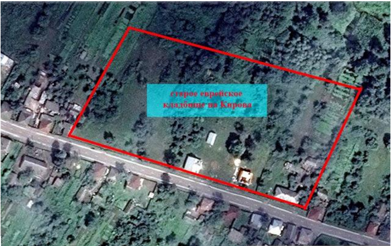
Старое еврейское кладбище на ул. Кирова между домами №45 и 59