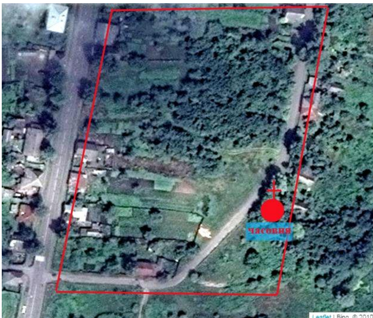
Старое кладбище на ул. Набережная

Некоторые участки и постройки стоят на старых могилах.