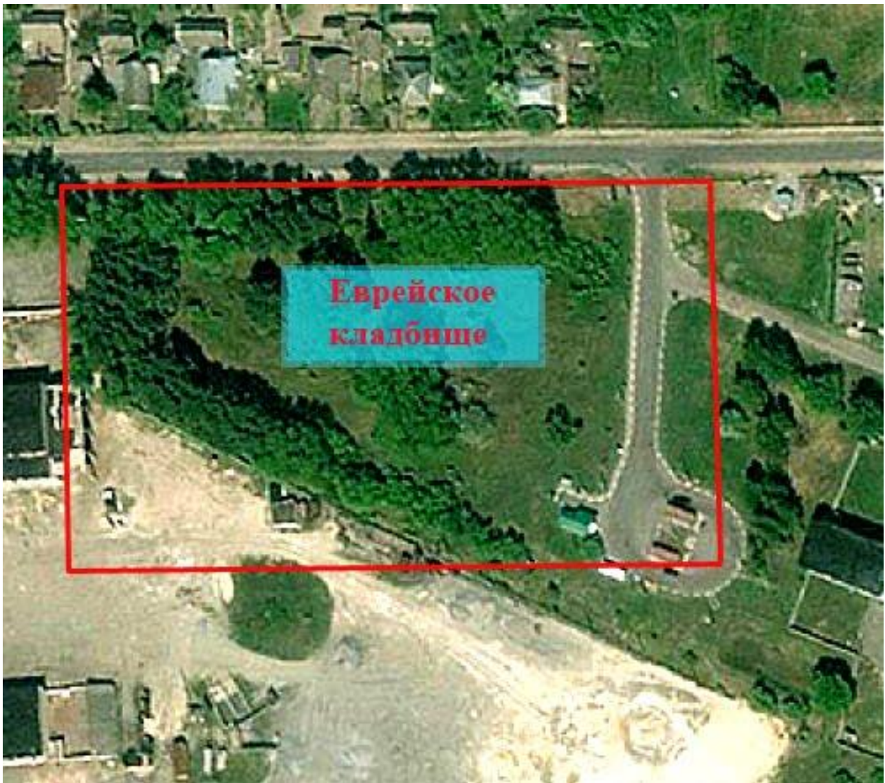
Примерный размер второго еврейского кладбища

Самые старые захоронения на сохранившейся части – это 1940-е годы.